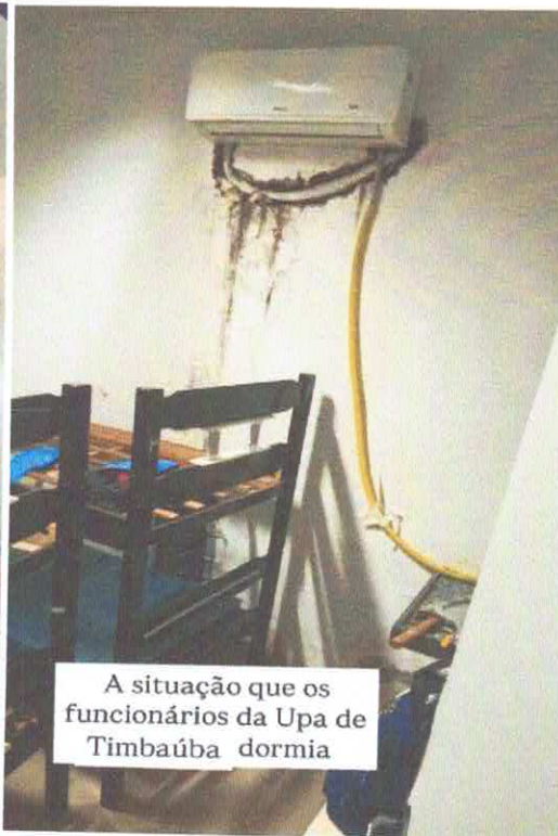
A situação que os funcionários da Upa de Timbaúba dormia